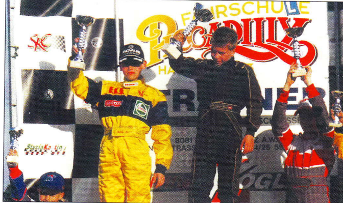
Auf der obersten Podeststufe beim Rennen in Graz.

Anfangen hatte es mit Indoor-Fahrten 1997 im inzwischen verblicheneren Motodrom Grödig. Dann kam das Rennfieber und führte im Vorjahr zur ersten Meisterschaftssaison und gleich zu Rang 6 der Kadetten-Kategorie. Heuer stieg dieses